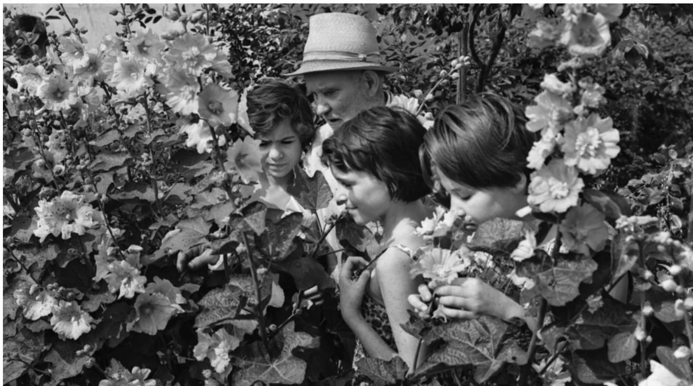
Житель одного из кварталов Черемушек украсил цветами и яблонями свой двор. Автор Л. Портер. Июль 1964 года. Главархив Москвы