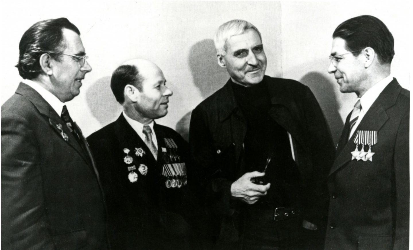
К.М. Симонов с ветеранами Великой Отечественной войны. Не ранее 1970-х гг.

На портале «МЭШ» размещены материалы Главрхива Москвы об отечественных мастерах слова, жизнь и творчество которых были связаны со столицей.