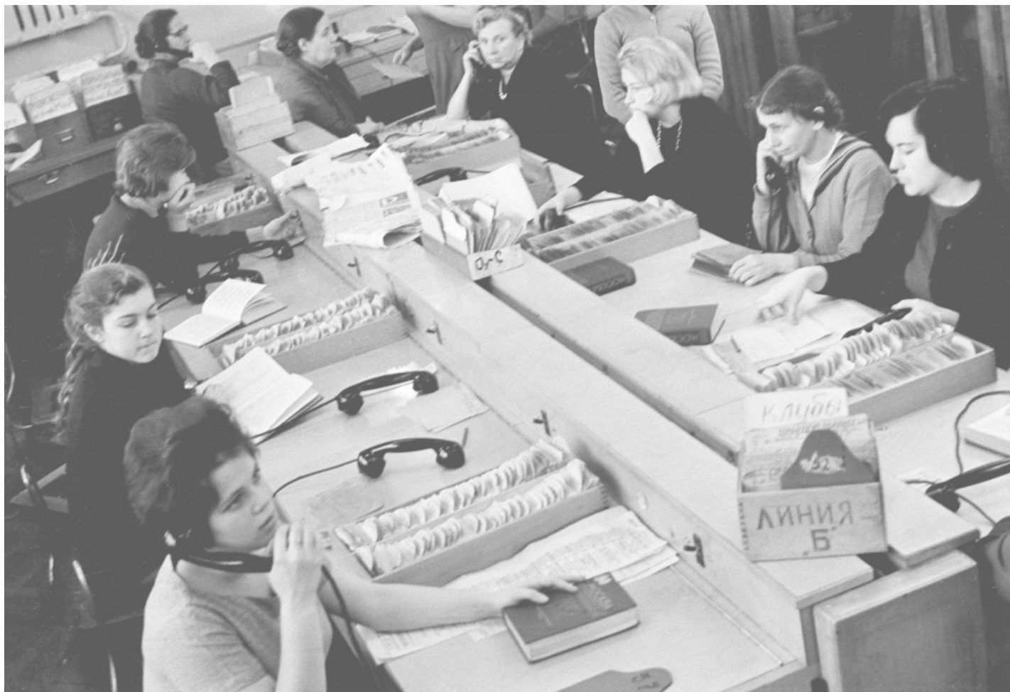
Сотрудники московской городской справочно-информационной конторы «Мосгорсправка» за работой. Автор В. Гендероте. Москва, декабрь 1962 года. Главархив Москвы

положение «Об адресных бюро и адресных столах в РСФСР». Бывшие конторы адресов формировались при управлениях милиции для регистрации и учета населения в городах и для выдачи адресных справок учреждениям и частным лицам.