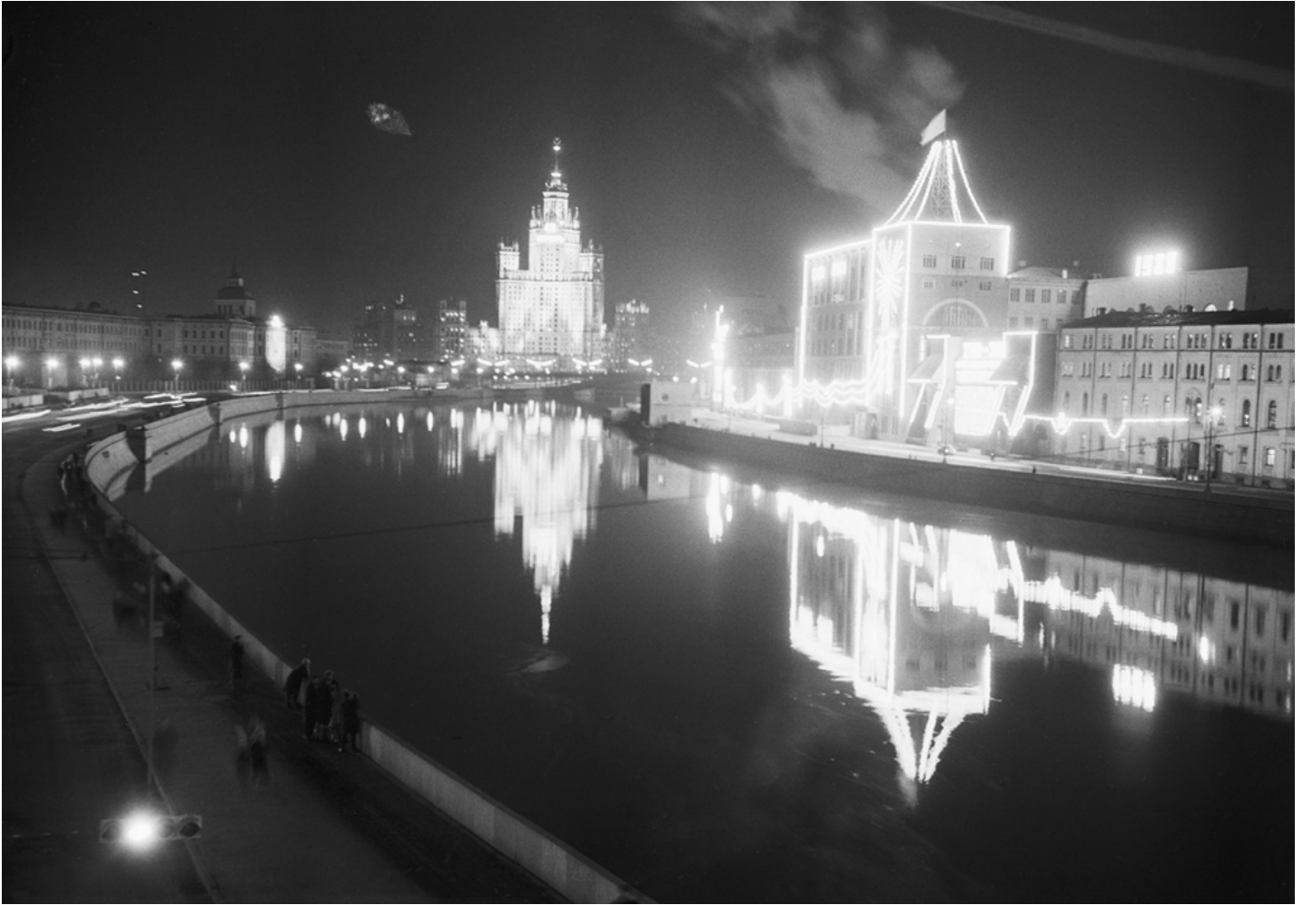
Праздничная иллюминация здания МОГЭС (справа) в канун 45-й годовщины Великой Октябрьской Социалистической революции. Москва. 06 ноября 1962 г.

28 ноября 1897 года состоялся пуск первой очереди Центральной электрической станции. В Архивном фонде Москвы хранятся документы, связанные с её историей.