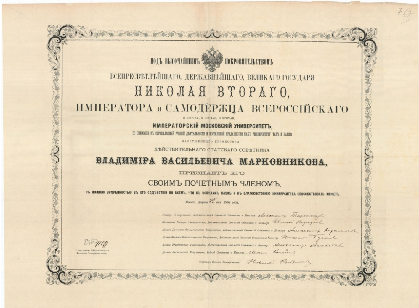
Диплом В.В. Марковникова на звание почетного члена Московского университета. 22 марта 1901 г. Главархив Москвы.

181 год назад родился Владимир Васильевич Марковников (1838-1904) - один из самых известных химиков России, основатель собственной научной школы в Московском университете.