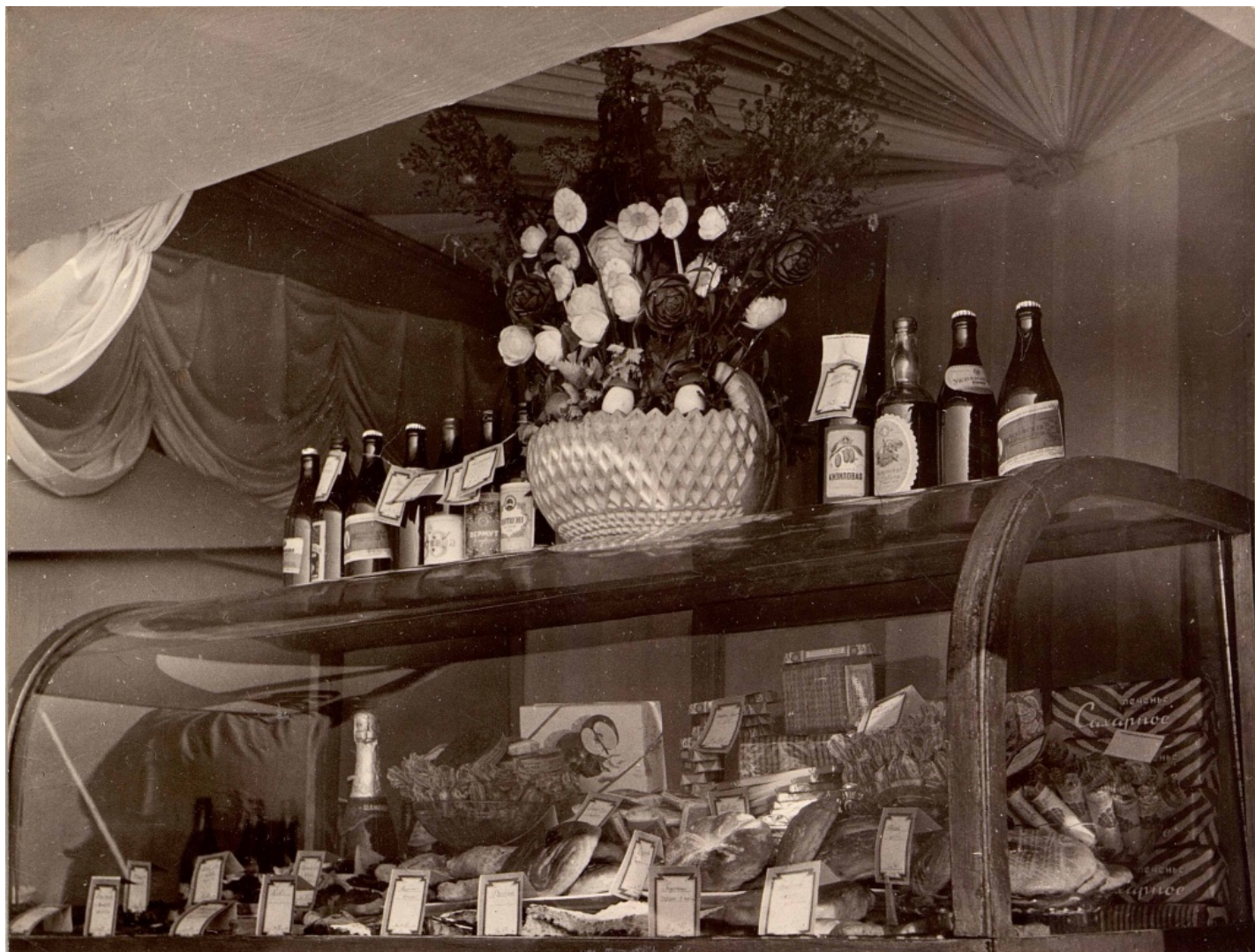
Фото из «Альбома показательного обслуживания в местах массового отдыха». Москва. 1946–1952 гг. Главархив Москвы.

Одной из примет жизни столицы конца 1940-х годов стала традиция встречи Нового года в ресторанах и кафе. О малоизвестных деталях организации бытового обслуживания горожан и о том, что было в новогоднем меню 1950 года, расскажут документы Архивного фонда Москвы.