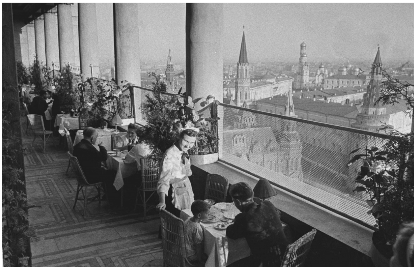
В кафе «Птичий полет» на балконе 15-го этажа гостиницы «Москва». 1947 г.

На сладкое был пломбир, из расчета 100 грамм на каждого гостя. Особо дефицитное в зимнюю пору фруктовое меню включало яблоки и мандарины, а утолить жажду можно было черным кофе с лимоном, нарзаном, фруктовой водой. Предлагались и алкогольные напитки – шампанское, вино, портвейн и водка сорта «Московская особая». И, конечно, к столу подавали белый и ржаной хлеб (по 150 и 100 грамм соответственно). Любопытно, что в стоимость торжества входили расходы на оформление (3 рубля).