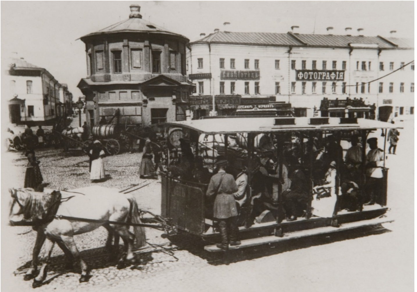
Вагон конно-железной дороги на одной из московских улиц. Москва. [1910] г.

Главархив Москвы знакомит с малоизвестными документами об одном из первых видов общественного транспорта столицы.