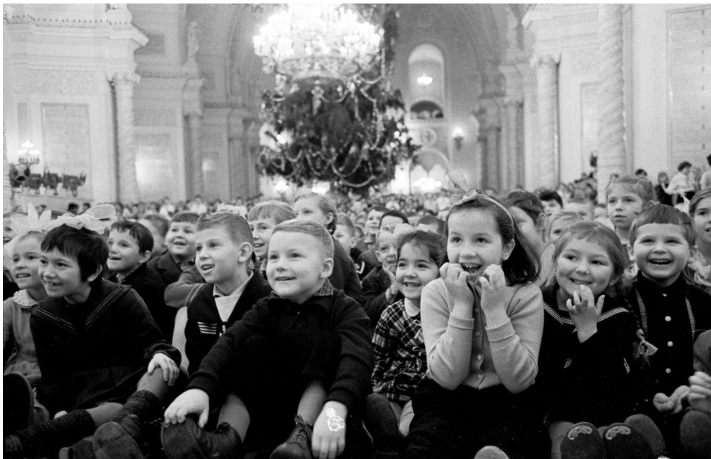
Дети на празднике Новогодней ёлки в Георгиевском зале Большого Кремлёвского дворца. Январь 1961 г.