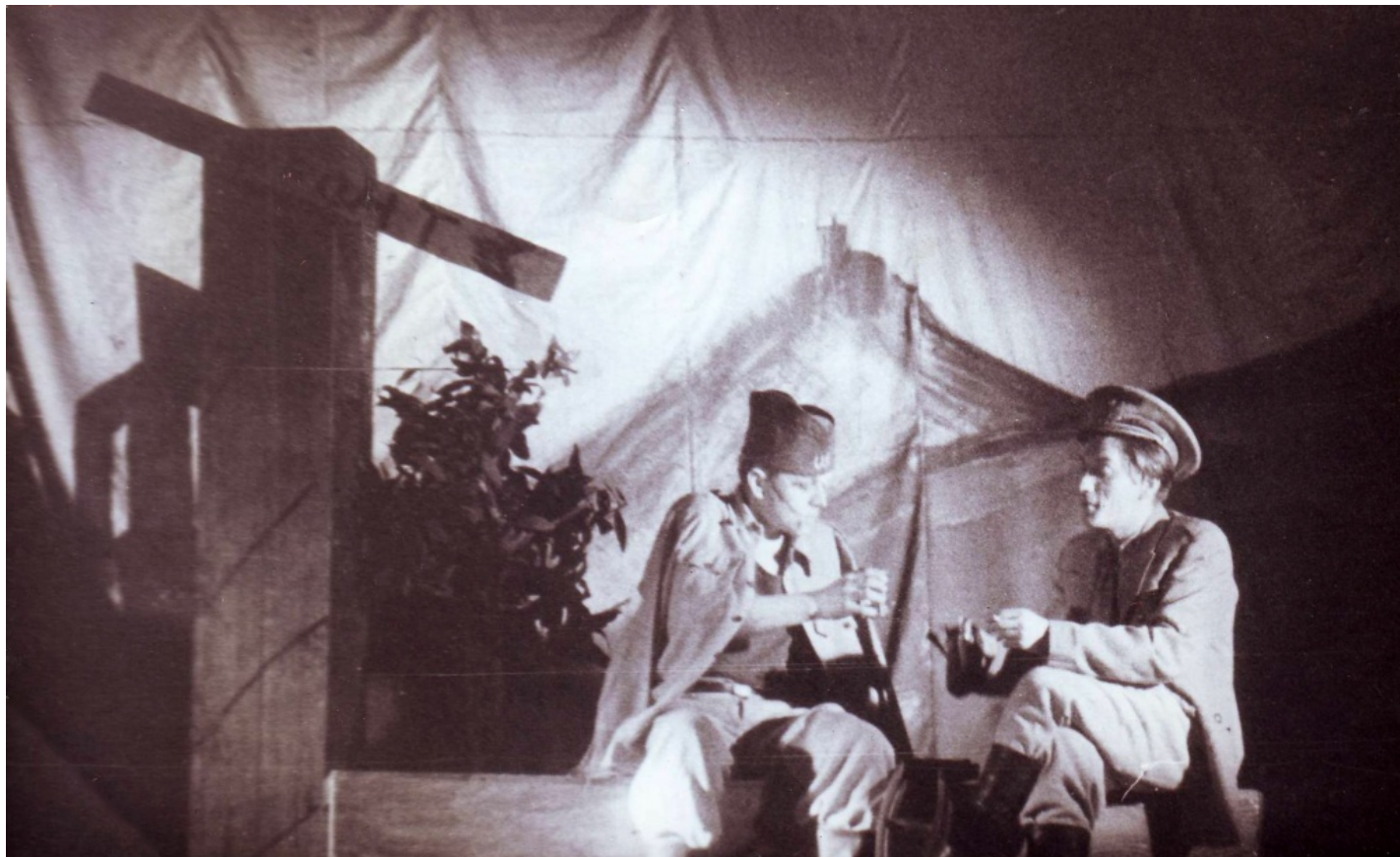
Фотографии сцен представления сатирического обзора «Телевизор», самодеятельного театрального коллектива МАИ им. Серго Орджоникидзе. 1950-е гг.