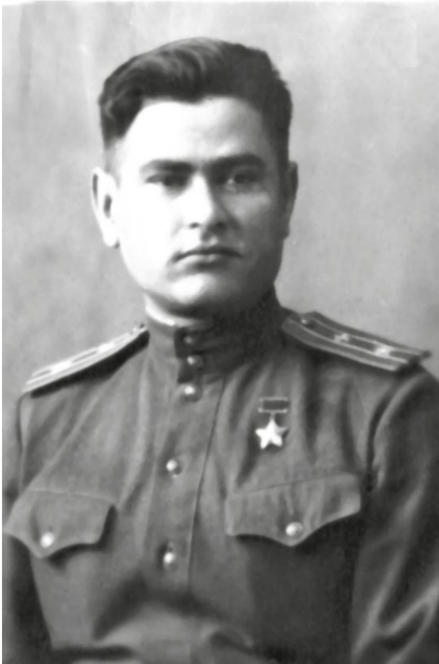
Фотография А.П. Маресьева. Не ранее 22 июля 1946 г.