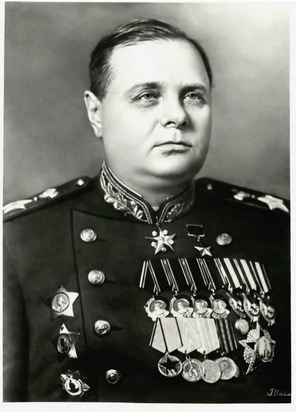
[1951 г.]

Заместителю командира эскадрильи 63-го гвардейского истребительного авиационного полка Маресьеву Алексею (1916–2001) звание Героя Советского Союза было присвоено 24 августа 1943 года за образцовое выполнение заданий командования на фронте борьбы с немецкими захватчиками и проявленные при этом отвагу и героизм. 4 апреля 1942 года в воздушном бою в районе Демянского плацдарма самолет гвардии старшего лейтенанта Маресьева был подбит. После ампутации голени обеих ног он освоил протезы, прошел медкомиссию и в июне 1943 года вернулся в строй. С августа 1941 года по август 1943 года Алексей Маресьев совершил 86 боевых вылетов, осуществил 20 штурмовок живой силы и военной техники противника, сбил шесть вражеских самолетов.