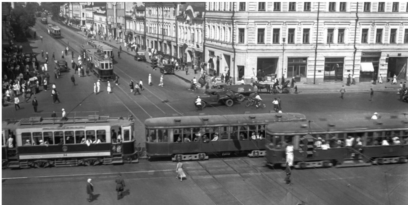
Трамвайное движение на улице Воздвиженка. 1933 год.