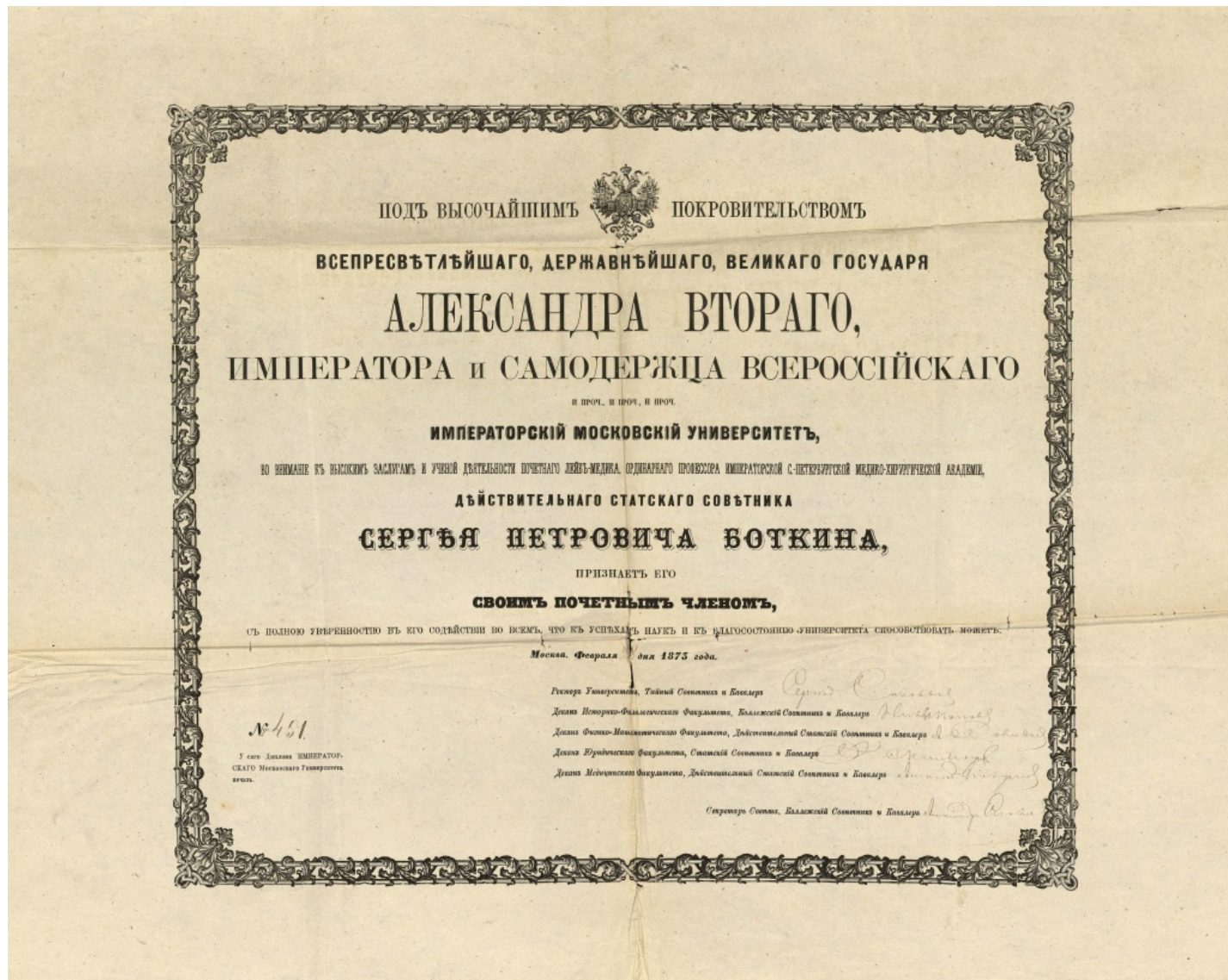
Диплом о присуждении С.П. Боткину звания почетного члена Московского университета. 28 февраля 1873 г.

Представляет интерес и другой документ - диплом о присуждении Сергею Боткину звания почетного члена Московского университета. Из документа следует, что университет признает действительного статского советника Сергея Боткина почетным членом университета. Звание почетного члена университета присваивалось в знак признания особых заслуг в области науки и просвещения.