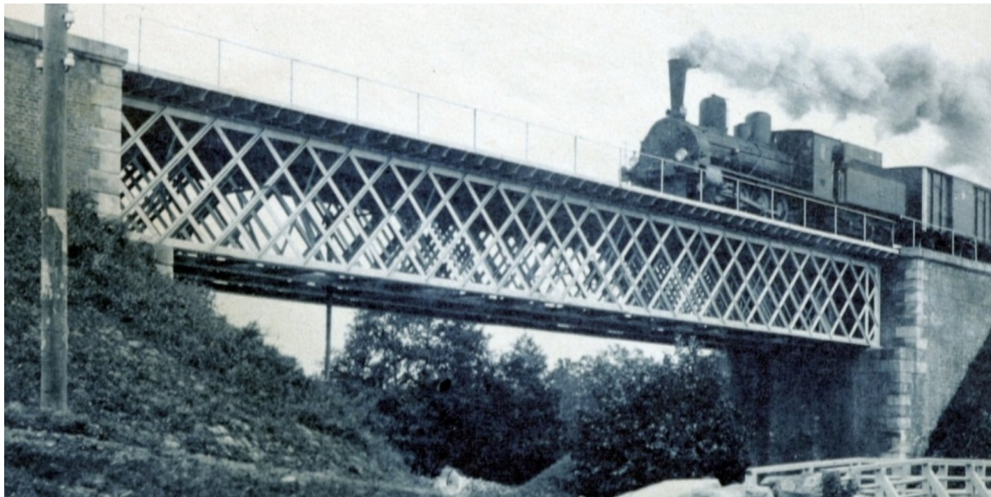
Железнодорожный мост с идущим по нему поездом. Автор А. Гаврилов. Начало XX века. Главархив Москвы

Читатели смогут узнать, как ловили безбилетников и боролись с курильщиками в конце XIX — начале XX века, о цене на проезд, льготах и многом другом.